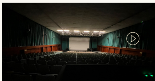
© Promo H.86 - 30 septembre 2023